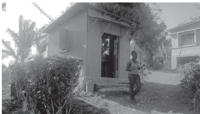
Figura 2: Punto de encuentro en el entorno negro, Distrito Woodside, Jamaica.

Al final de su estadía, esta estudiante parecía haber desarrollado un aprecio que rayaba en el asombro por la fuerza de las mujeres que conoció en este entorno. Aunque no hizo una comparación explícita entre lo que vio en la comunidad y la multiplicidad de tareas que probablemente realizan las mujeres negras de su entorno, su afirmación de que estas son “mujeres negras muy típicas” implica que hay ejemplos de fortaleza comparables. A pesar de las diferencias que estuvieron a punto de ensombrecer esta experiencia transcultural inicialmente, las similitudes entre estos diferentes grupos de personas de la diáspora fueron sumamente fuertes.