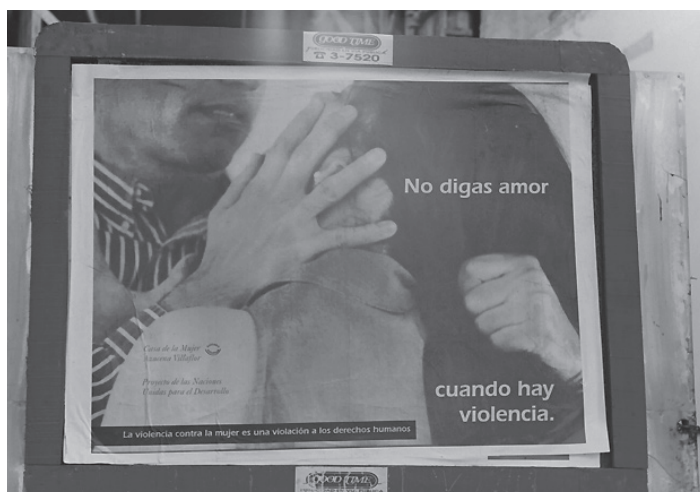
Campaña de afiches "No digas amor cuando hay violencia", La Plata, Argentina, 1995. (Alternativa 1)