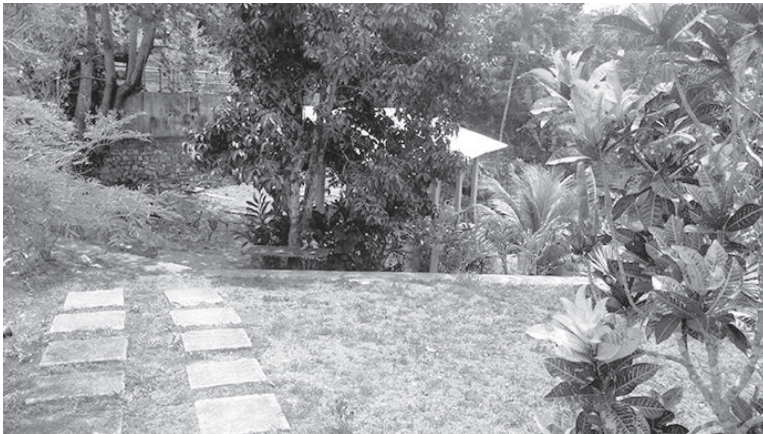
Figura 1: Hojas de crotón, tienda de la vereda. Distrito Woodside, Jamaica.