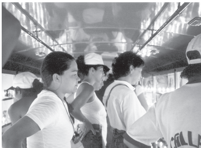
Proyecto arte público "La piel de la memoria," Medellín, Barrio Antioquia, 1999.

Fueron más de 2000 objetos, 2000 historias, y estaban los obituarios, las fotos y prendas de jóvenes que habían sido asesinados, o fotos de la novia o el novio, o la hermana o la madre que alguien había entregado como su objeto significativo y todos estaban en el museo, incluso algunos que eran sobre jóvenes de bandas enemigas. Objetos instalados en un ambiente ritualizado, respetuoso, hermoso, elegante en el mejor sentido de la palabra. Había como 300 muñecos de peluche, pero cada uno contaba una historia totalmente diferente. Esto es una instalación y puesta en escena en la que la gente al mirar y entrar en relación con los objetos genera asociaciones y relaciones; son objetos-puente que conectan la pérdida material y humana al cuerpo y al mundo material.