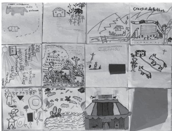
Colcha de retazos elaborada por personas en situación de desplazamiento interno, Medellín, 2004.

Lo interesante es que en esta acción de la comunicación no importa el producto final, es un ejercicio de agencia y de producción de sentido con uno mismo, pero en relación con quienes participan y escuchan. Lo que pasa con ciertas experiencias es que de pronto se encuentra un lenguaje posible para comunicar, y puede ser oral como cuando se cuentan una anécdota, o simbólico mediante imágenes como en la colcha de retazos, corporal como en los mapas del cuerpo, o de sentido del lugar como en los mapas. Cuando se narra o cuenta desde estos diferentes lenguajes, lo que incluye el silencio, la risa, los secretos y énfasis narrativos, hay un repertorio de gestos de comunicación hacia otros y hay una cierta escucha, y en ese diálogo y escucha pasa algo en términos de posibilidad de darle sentido. El sentido no es finalmente poder verbalizar o superar el trauma; pero sin embargo a veces el taller abre la posibilidad de dar ese paso de decir “no fui la única persona que carga con el dolor. Algo así le pasa a otras personas que tampoco pueden hablar”. Entonces es la posibilidad de la pluralidad de sentidos y la diversidad de lenguajes. 130