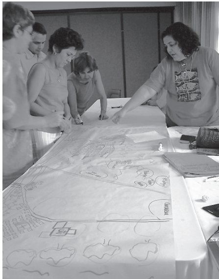
Mapa mental elaborado por gestores de memoria de Montes de María, 2000

Lo que aprendí en la investigación en Medellín es que precisamente lo que la violencia hace no sólo es la destrucción física, o, lo que le hace a las personas físicamente, sino que tiene que ver con destruir mundos y relaciones y con agotar el lenguaje posible [para nombrar o decir esa experiencia] porque la experiencia es tan difícil que no hay lenguaje para aprehenderla y comunicarla. En los talleres de memoria se activaban momentos donde el lenguaje se apropia de la vivencia, y a la persona que está narrando su vivencia se le abre en el espacio, un camino para que habite e incorpore esa experiencia de manera expresiva, para darle cierto sentido y logre aprehender su cotidianidad desde el narrar (que no siempre se expresa verbalmente).