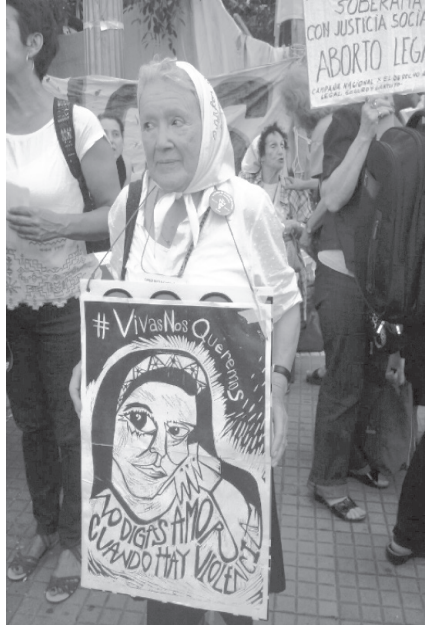
La consigna "No digas amor cuando hay violencia" en la Campaña #VivasNosQueremos, 2015.