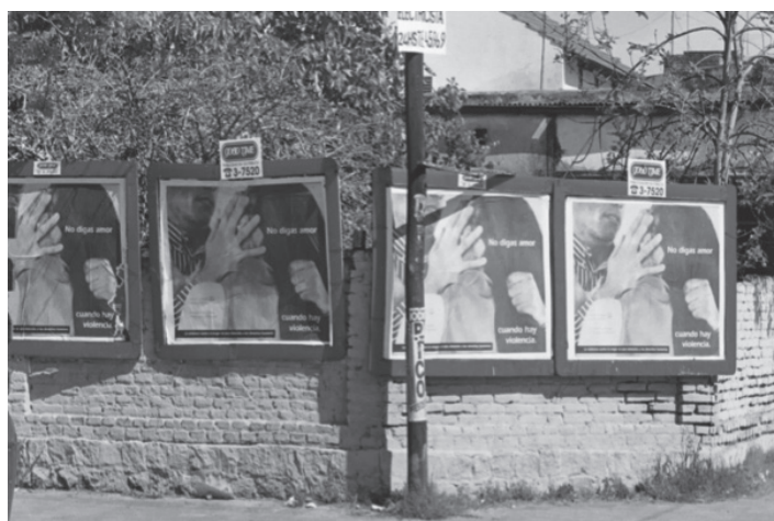
Campaña de afiches "No digas amor cuando hay violencia", La Plata, Argentina, 1995 (Alternativa 2)